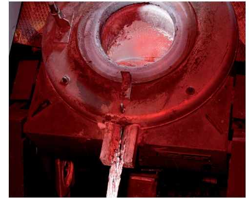
Tiegel können zum Schmelzen und Warmhalten verwendet werden

Detaillierte Informationen zur Anwendungsempfehlung finden Sie im entsprechenden Produktdatenblatt.