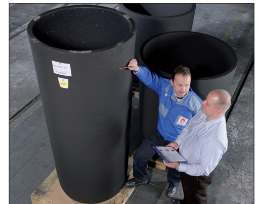
Maßgeschneiderte Tiegel werden angeboten