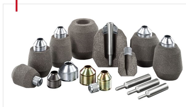
Produktportfolio FEEDEX FEF VAK

Einsatz der neuen FEEDEX FEF Rezeptur in Verbindung mit der VAK Technologie.